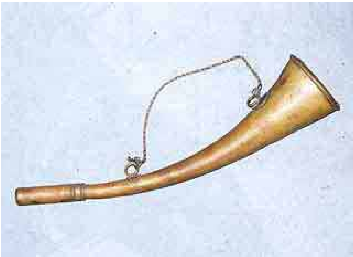
Trompetilla que utilizaba el pregonero.

Muy popular en todos los pueblos de España, con su corneta apuntando al cielo iba parando por todas las esquinas y Tuuuuuuuuuu ... comunicaba a la población los bandos del ayuntamiento, los trabajos comunales y cualquier acontecimiento que rompiera la monotonía del pueblo.