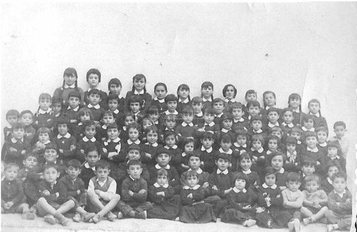
La Puebla de Montalban, colegio de María Inmaculada ("las monjas") curso 1958-59