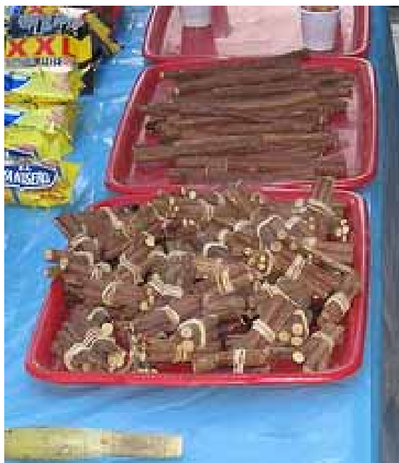
Arrezul ó Palodul.

La raíz del “ orozuz ” (que así es como se llama el “ arrezul ”, es una desvirtuación de la palabra “ orozuz ”) es el “ regaliz ”. Otros también lo han llamado “ palodul ” y “ paloduz ”. Con esta última acepción aparece en el diccionario con el significado de “ palo dulce ” y “ orozuz ”.