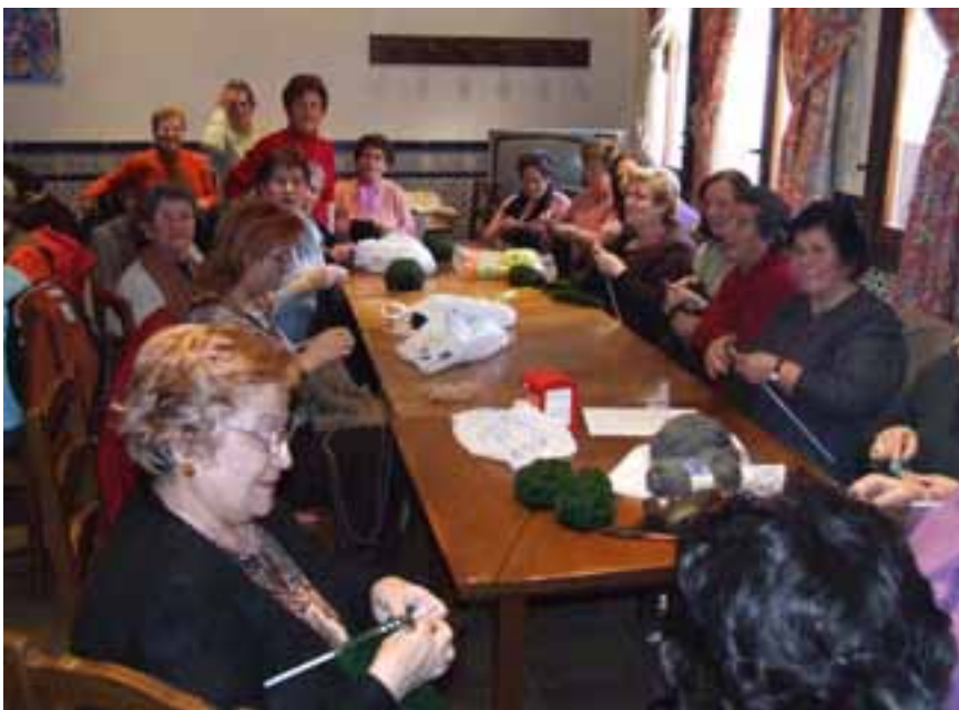
Participantes “Taller de Costura”.