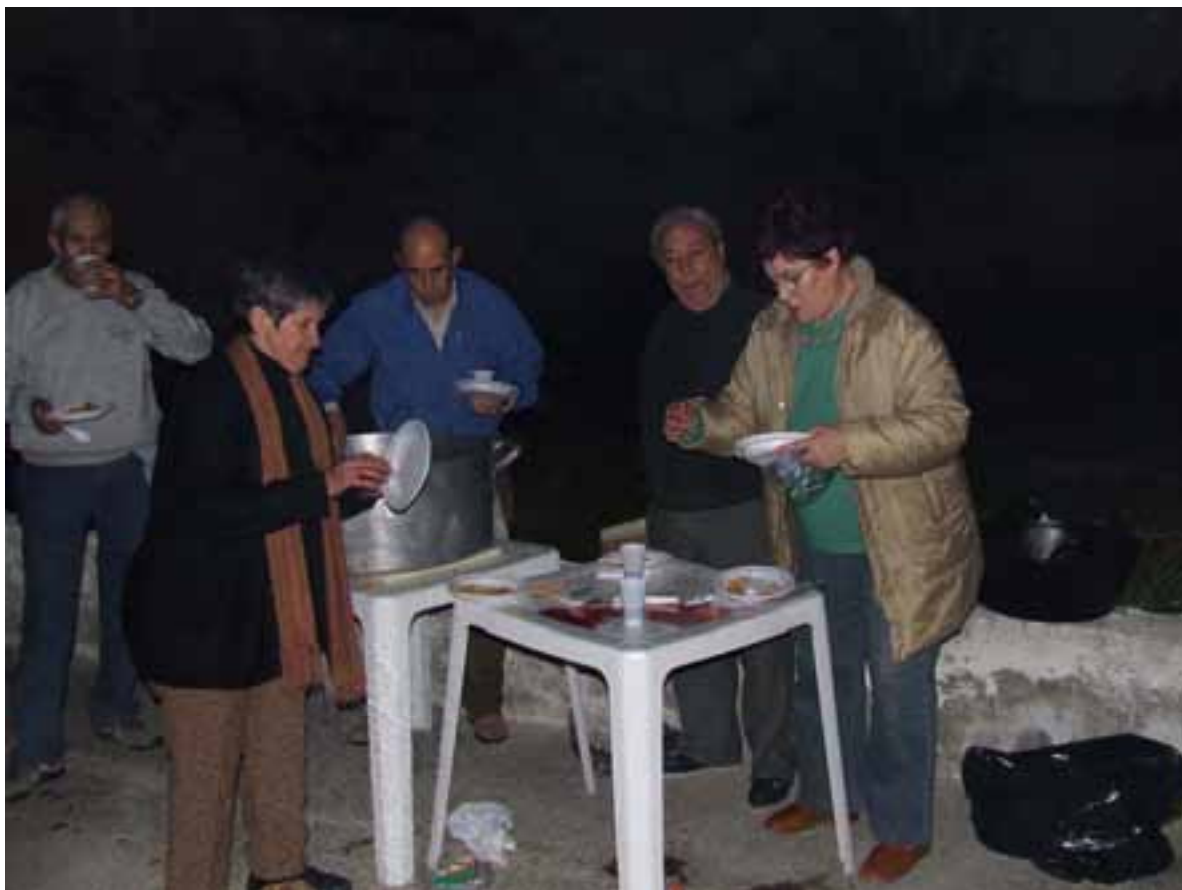
Elaboración “Migas” Navideñas en las Viviendas Tuteladas 2007.